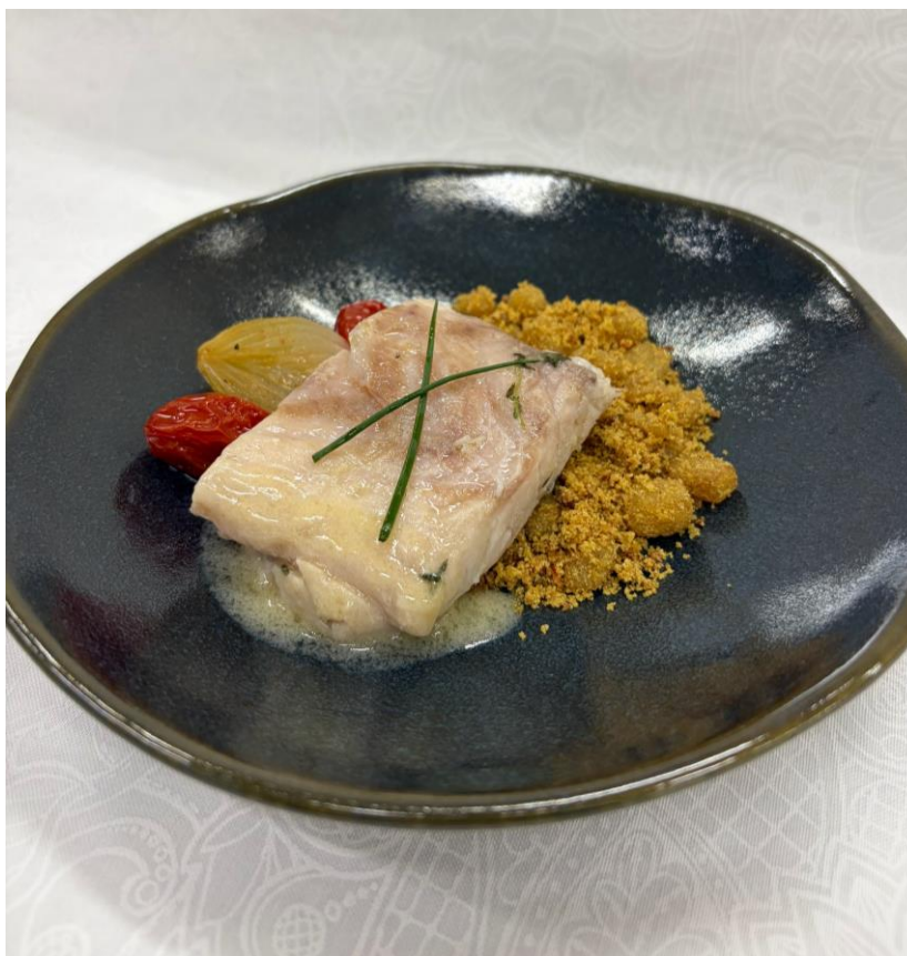
Figura 4. Maré de Sorte.

Preparou-se, também, um molho para o peixe (Anexo 10) , feito a partir do caldo proveniente da cocção da pescada amarela no sous-vide , que foi reduzido e posteriormente emulsionado com manteiga gelada para melhor fluidez. A montagem envolveu o filé de pescada amarela ao centro, destacado, com uma meia-lua de farofa de banana-da-terra à sua direita e a mini-cebola com os tomatinhos na lateral esquerda (Anexo 11). De modo a finalizar, foi colocado o molho sobre a parte inferior do peixe, e decorado com ciboulette (Figura 4).