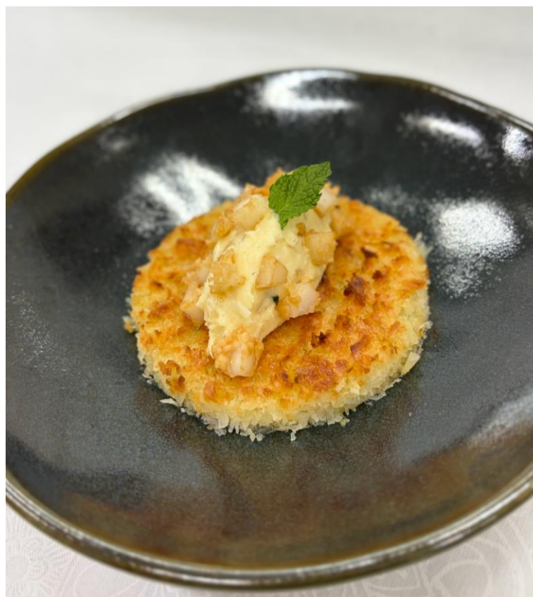
Figura 5. Três Mares de Coco.