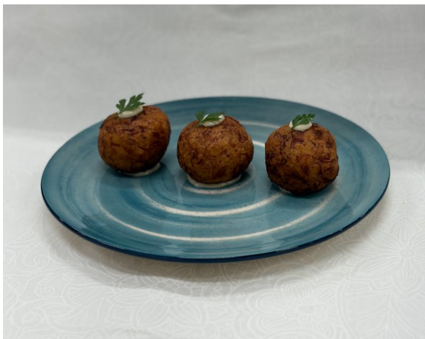
Figura 3. Das Ondas, às Raízes.

A montagem da entrada foi feita adicionando três círculos de maionese em uma mesma reta, para serem posicionados um bolinho em cima de cada círculo (Anexo 5). O molho, dessa maneira, contribui para “fixar” o bolinho no prato, servindo como base para não o deixar escorregar e manter o alinhamento do empratamento. Para finalizar, foram adicionados pontos de maionese de manjerição em cima de cada bolinho e uma folha de salsa crespa (Figura 3).