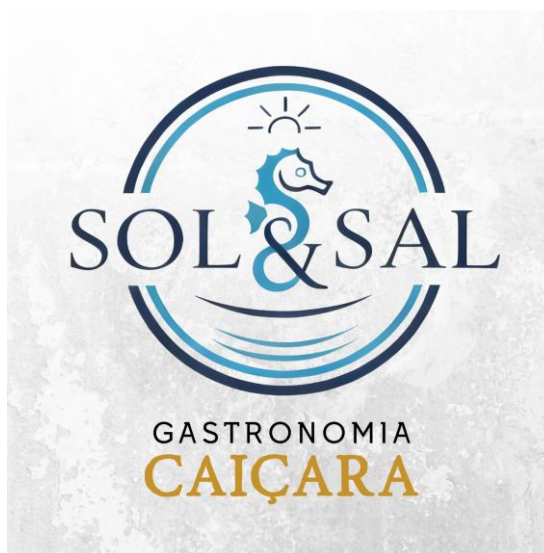
Figura 2. Logotipo

A imagem foi criada com o auxílio de inteligência artificial seguindo informações fornecidas pelas empreendedoras e modificações feitas em aplicativo de design gráfico.