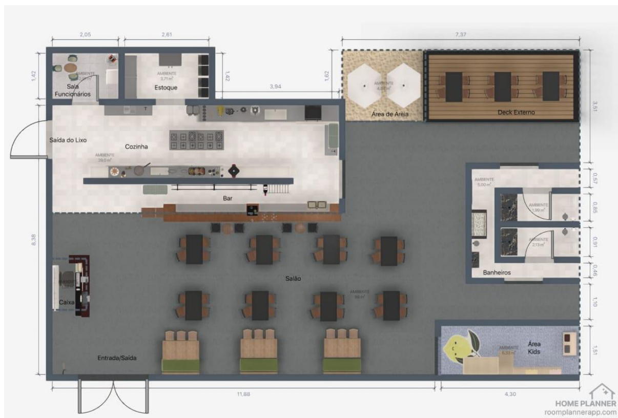
Figura 1. Layout do estabelecimento

Uma representação do layout (Figura 1) do estabelecimento “Sol & Sal” pode ser melhor observado abaixo: