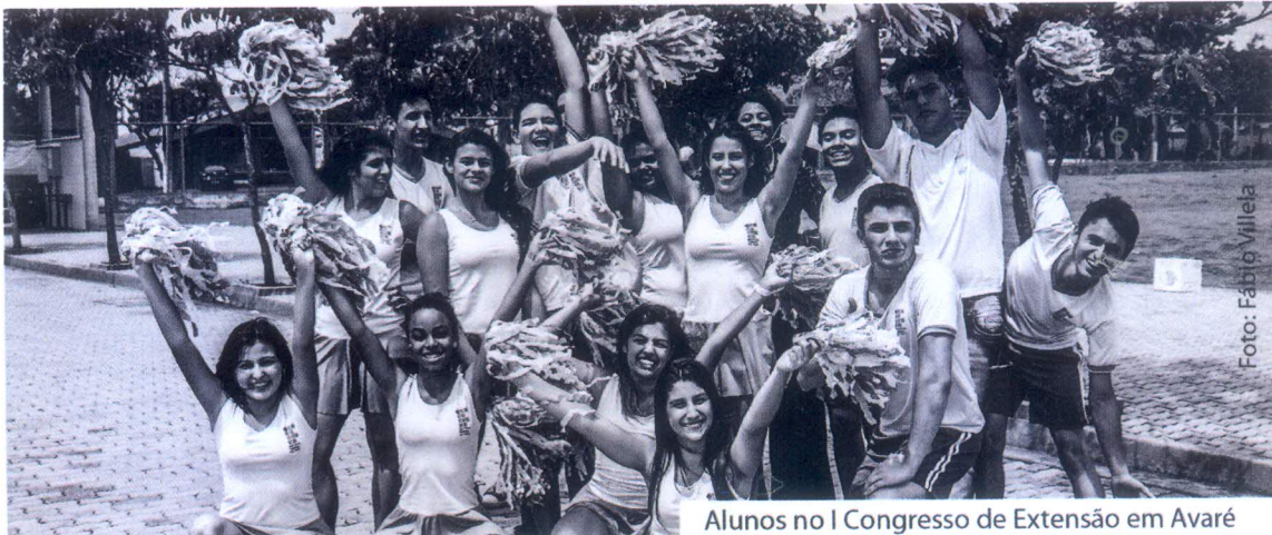
Alunos no I Congresso de Extensão em Avaré