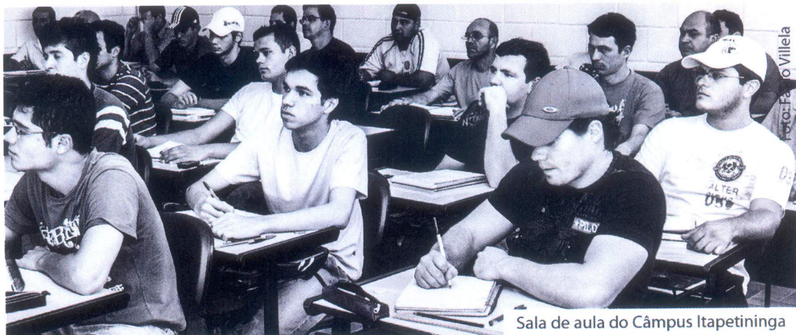
Sala de aula do Câmpus Itapetininga