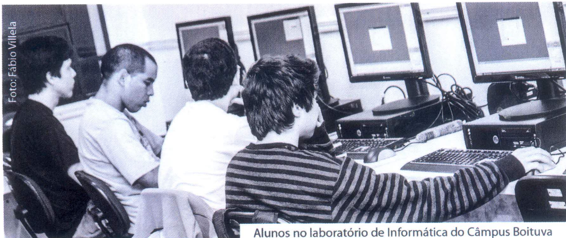
Alunos no laboratório de Informática do Câmpus Boituva